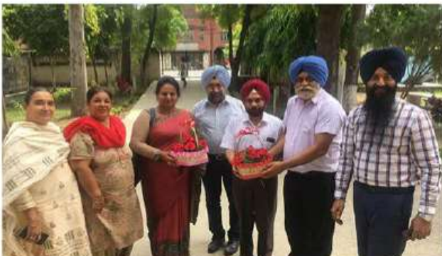
ਕਾਲਜ ਵਿਖੇ ਰੂਸਾ ਫੰਡਜ਼ ਦੀ ਇੰਸਪੈਕਸ਼ਨ ਕਰਨ ਆਈ ਟੀਮ ਦਾ ਸਵਾਗਤ ਕਰਦੇ ਹੋਏ ਪ੍ਰਿੰਸੀਪਲ ਤੇ ਸਟਾਫ਼ ਮੈਂਬਰਾਨ