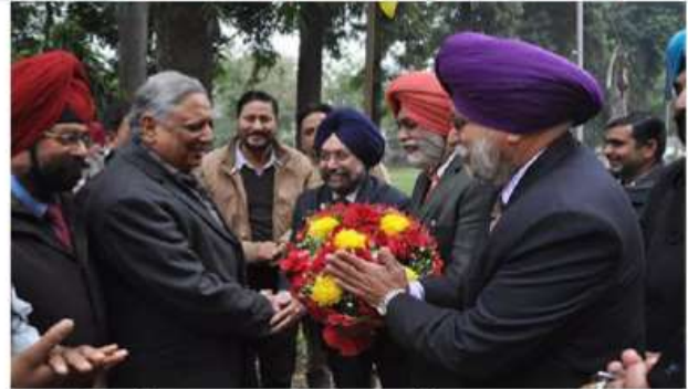
ਕਾਲਜ ਦੇ ਨਵੇਂ ਕਾਮਰਸ ਅਤੇ ਹੋਮ ਸਾਇੰਸ ਬਲਾਕ ਦੇ ਉਦਘਾਟਨ ਸਮੇਂ ਪੰਜਾਬ ਵਿਧਾਨ ਸਭਾ ਦੇ ਸਪੀਕਰ ਮਾਣਯੋਗ ਰਾਣਾ ਕੇ.ਪੀ. ਸਿੰਘ ਜੀ ਦਾ ਸਵਾਗਤ ਕਰਦੇ ਹੋਏ ਕਾਲਜ ਦੇ ਪ੍ਰਿੰਸੀਪਲ ਅਤੇ ਸਟਾਫ਼