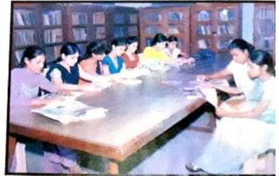
ਫਰੀ ਪੀਰੀਅਡ ਦੌਰਾਨ ਵਿਦਿਆਰਥੀ ਲਾਇਬ੍ਰੇਰੀ ਵਿਚ ਪੜ੍ਹਦੇ ਹੋਏ।